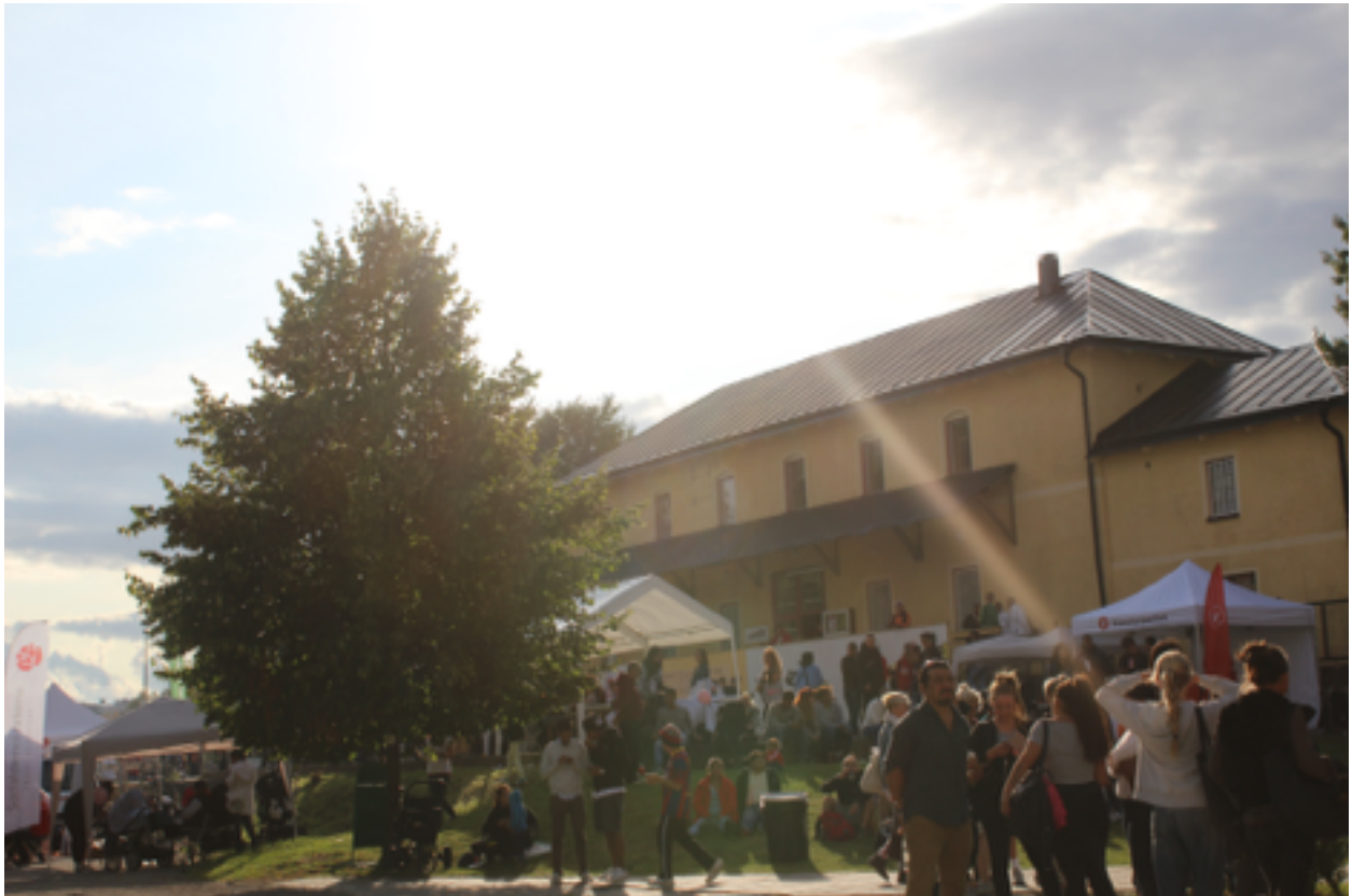
This Is Alby-festivalen 2014

En socioekologisk modell för ökat lokalt engagemang och stärkandet av civilsamhället.